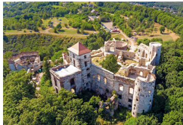
Zamek Tenczyn w Rudnie

32.5 Parking obok ścieżki prowadzącej do ruin zamku Tenczyn w Rudnie G . Zamek wzniesiony na szczycie dawnego wulkanu. Dokonał tego w XIV w. jeden z najzamożniejszych i najbardziej wpływowych rodów w Polsce –ród Tęczyńskich. W XVI w. warownię przebudowano, nadając jej cechy magnackiej rezydencji z bastionami arkadowymi i kruzgankami. W 1656 r. zamek został spalony w czasie potopu szwedzkiego.