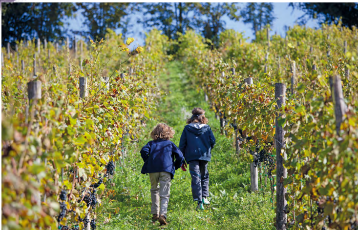
Winnica św. Jana

Na wina białe uprawia się tu odporne krzyżówki, jak: aurora , seyval blanc , krystały i swenson red , a także swoją jutrzenkę . Na terenie winnicy znajduje się wygodne miejsce do degustacji w przebudowanej na winiarnię starej stodoły.