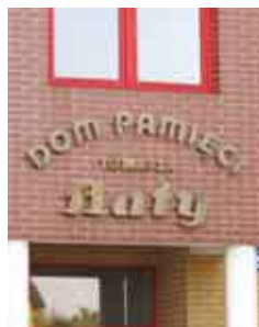
Dom Pamięci Baťy w Chełmku/Pamětní Baťův dům v Chełmku