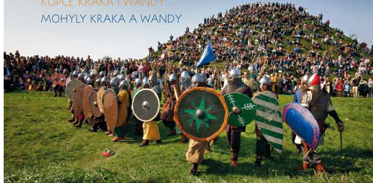
Rekawka – kopiec Kraka/Krakova mohyla – tradiční Rekawka