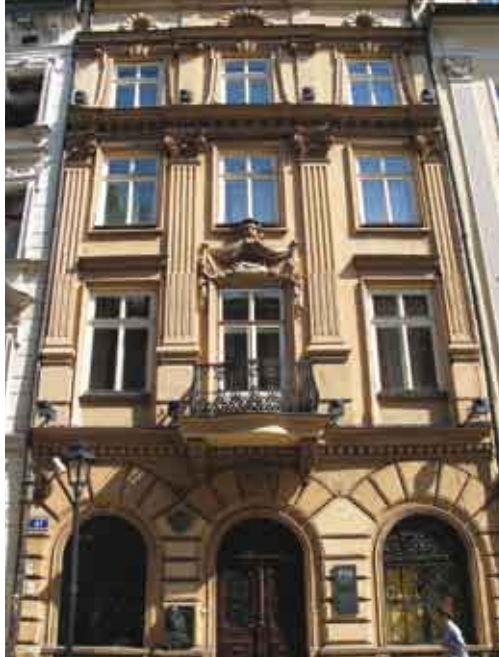
Dom Jana Matejki w Krakowie/Matejkův dům v Krakově