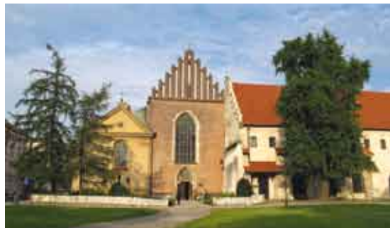
Kościół i klasztor Franciszkanów w Krakowie/Františkánský kostel a klášter v Krakově, fot. M. Żerański