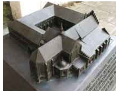
Makieta kościoła i klasztoru Franciszkanów/Maketa františkánského kostela a kláštera