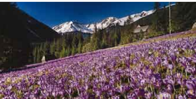
Tatry – Dolina Chochołowska/Tatry – Hala Chochołowska