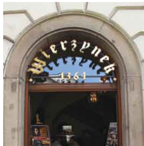
Restauracja „Wierzynek”/Restaurace Wierzynek