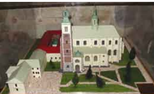
Makieta bazyliki w Miechowie/Maketa baziliky