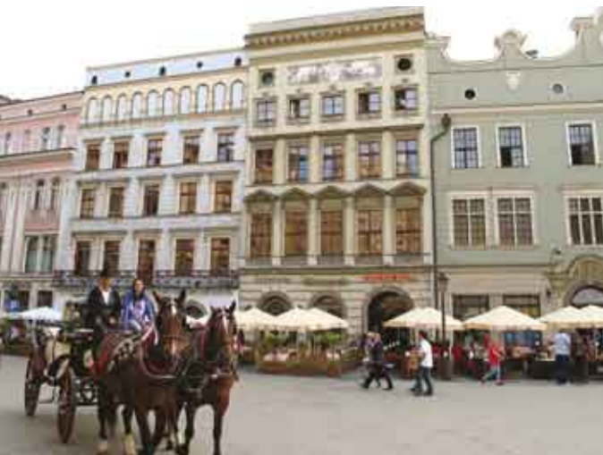
Kamienica Pinocińskich w Krakowie/Dům Pinocińských v Krakově, fot. M. Żerański