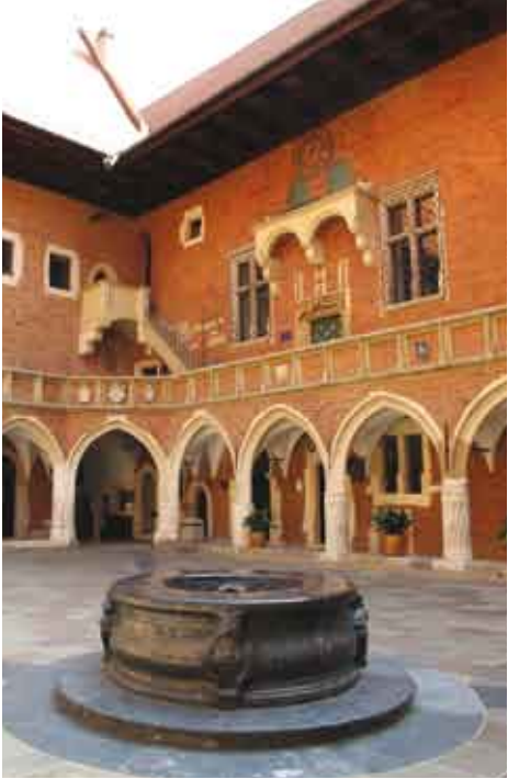
Collegium Maius Uniwersytetu Jagiellońskiego w Krakowie/Collegium Maius – muzeum Jagiellońskiej univerzity