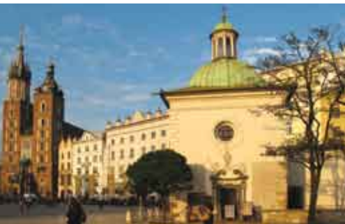
Kościół św. Wojciecha w Krakowie/Kostel sv. Vojtěcha v Krakově