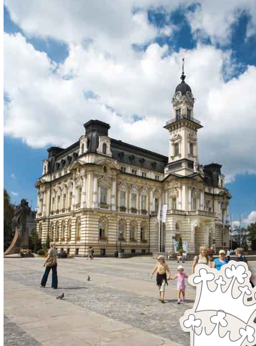
Ratusz w Nowym Sączu/Radnice v Nowém Sączu