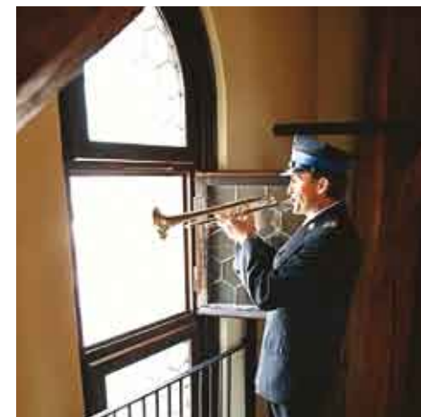
Hejnal Mariacki/Krakovský hejnal