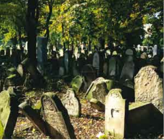
Cmentarz żydowski na Kazimierzu w Krakowie/Židovský hřbitov – Kazimierz v Krakově