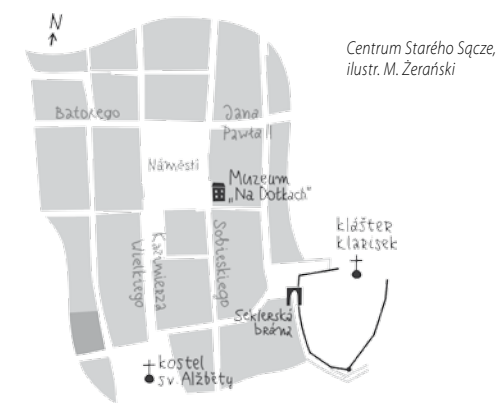
Centrum Starého Sącza, ilustr. M. Zerański