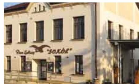
Dom Kultury „Sokół” w Trzebinii/Kulturní dům Sokol v Trzebinii