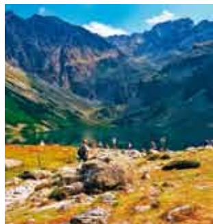
Czarny staw gasienicowy/ Pleso Czarny Staw Gąsienicowy