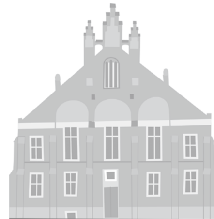
Siedziba Polskiego Towarzystwa Gimnastycznego „Sokół” w Krakowie/ Sídlo Polského tělovýchovného spolku Sokol v Krakově, rys. M. Žeraňski

pražský literát a publicista, propagátor česko-polské vzájemnosti a spolupráce, milovník Tater a městečka Zakopane; v r. 1892 ve zdejším Tatranském dvoře, v sídle spolku Towarzystwo Tatrzzańskie a místním kulturním centru, věnovala skupina nejvýznamnějších obyvatel Zakopaného polonofilovi z Prahy ozdobnou truhlici s tatranskými rytinami