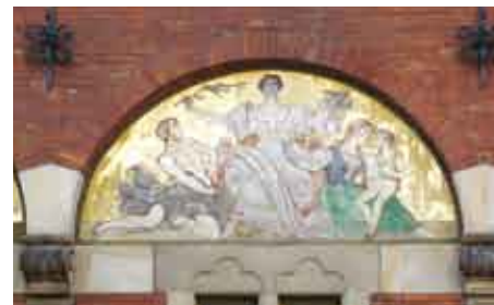
Siedziba Polskiego Towarzystwa Gimnastycznego „Sokół” w Krakowie/ Sídlo Polského tělovýchovného spolku Sokol v Krakově