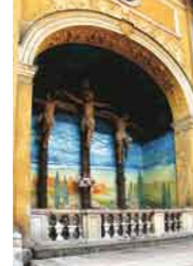
Kościół Karmelitów w Krakowie/Karmelitánský kostel v Krakově