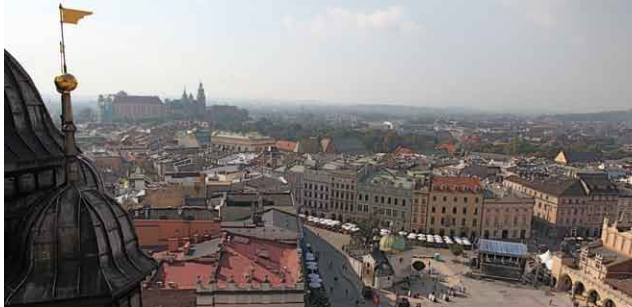
Kraków/Krakov, fot. Mateusz Zaręba