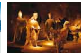
Kopalnia soli w Wieliczce/Solný důl ve Veličce