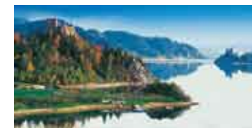
Czorsztyn i Niedzica