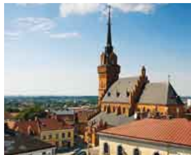
Bazylika Katedralna w Tarnowie/ Katedrála v Tarnově