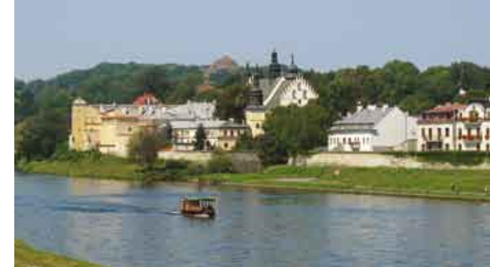
Kościół Norbertanek w Krakowie/Kostel a klášter norbertinek v Krakově