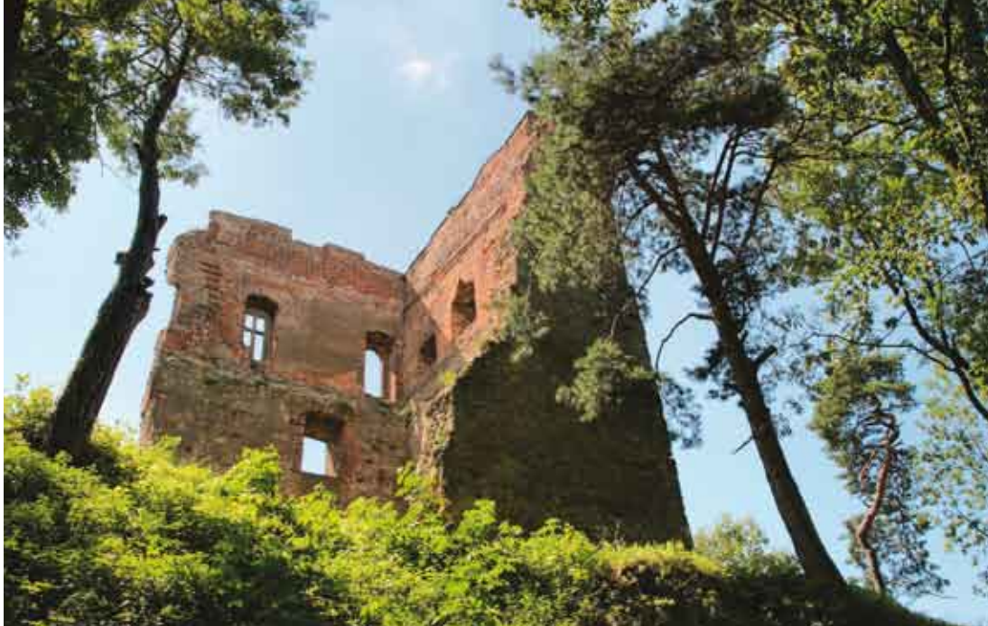
Ruiny zamku w Melsztynie/Zřícenina zámku v Melsztyně