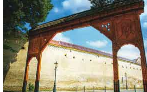
Brama Seklerska w Starym Sączu/Seklerská brána v Starém Sączu