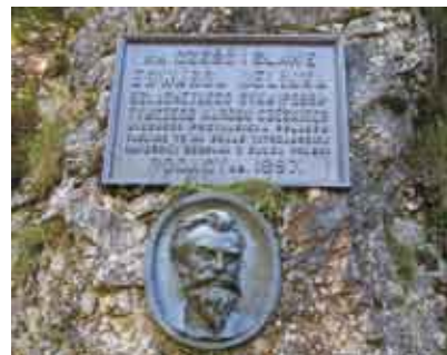
Skála im. Edwarda Jelinka/Skála Edwarda Jelinka