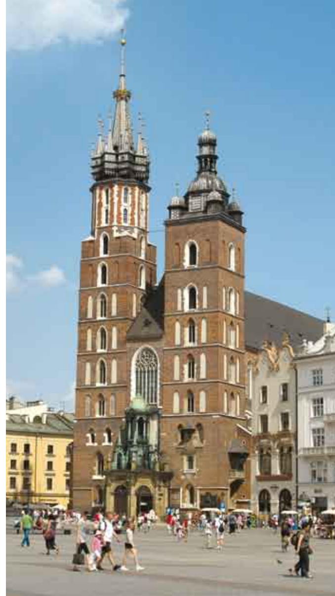
Kościół Mariacki/Mariánský kostel