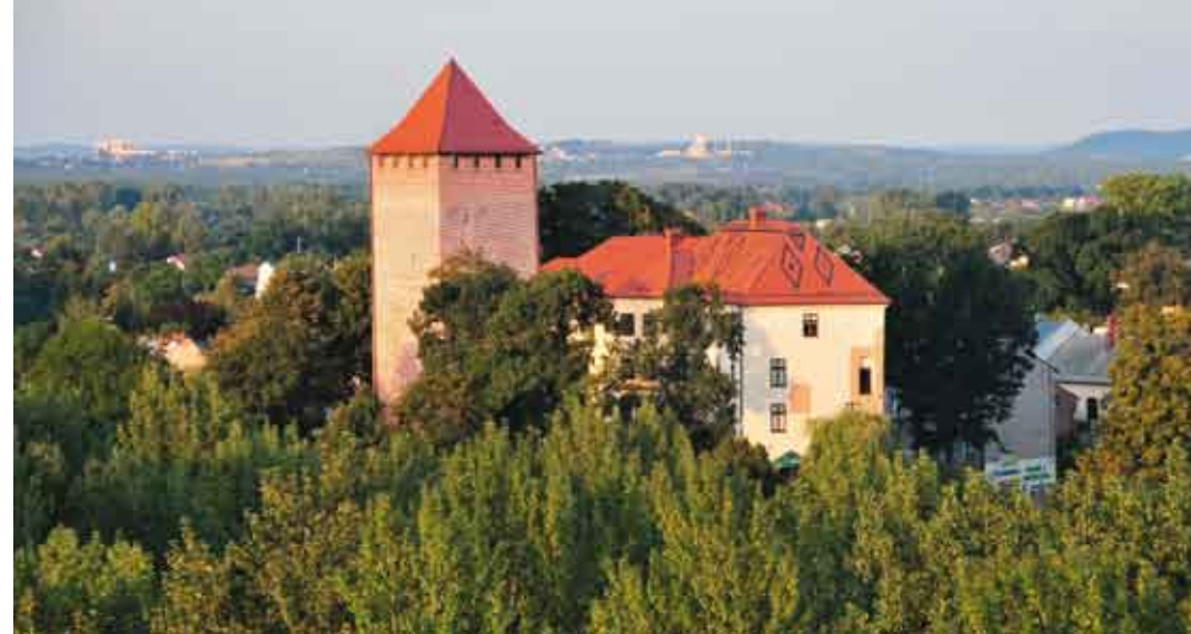
Zamek w Oświęcimiu/Zámek v Osvětimi