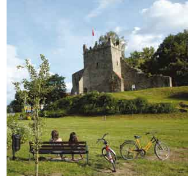
Ruiny zámku w Nowym Sączu/Pozůstatky královského hradu