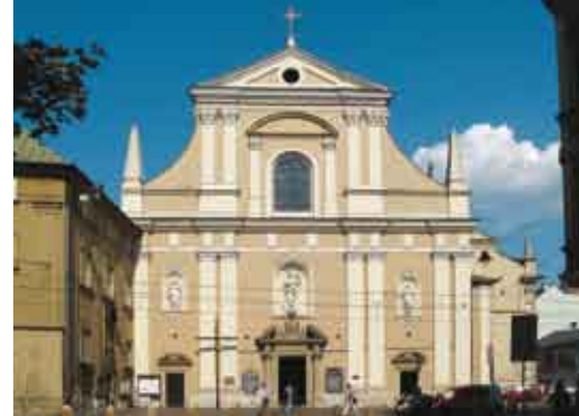
Kościół Karmelitów w Krakowie/Karmelitánský kostel v Krakově