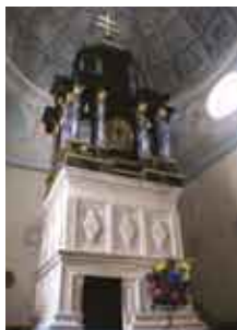
Replika Grobu Pańskiego w bazylice w Miechowie/Replika Božího hrobu – bazilika v Miechově