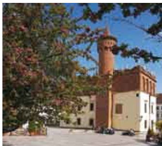
Ratusz w Tarnowie/Radnice v Tarnově