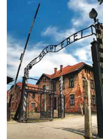
Obóz koncentracijny Auschwitz-Birkenau/Nacistický koncentrační a vyhlazovací tábor Auschwitz-Birkenau