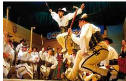
Karnawał Góralski/Horalský karneval