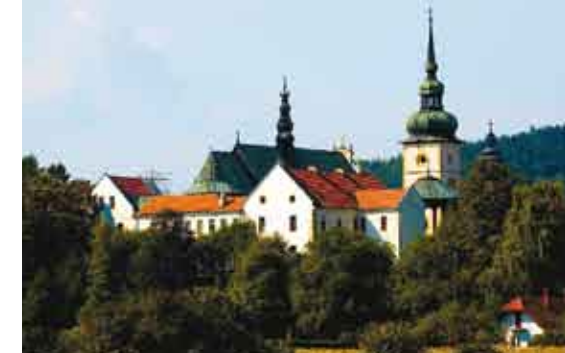
Klasztor Klarysek w Starym Sączu/Klásterní komplex řádu klarisek