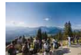
Tatry – widok na Gubałówkę/Pohled z Gubałówki

Liczba mieszkańców: 3,28 mln osób (ok. 8% ludności Polski)